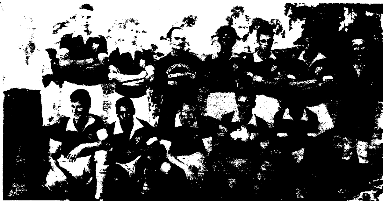
O time do Piraporinha FC no dia da vitória sobre o Coríntians: 12 de abril de 1959