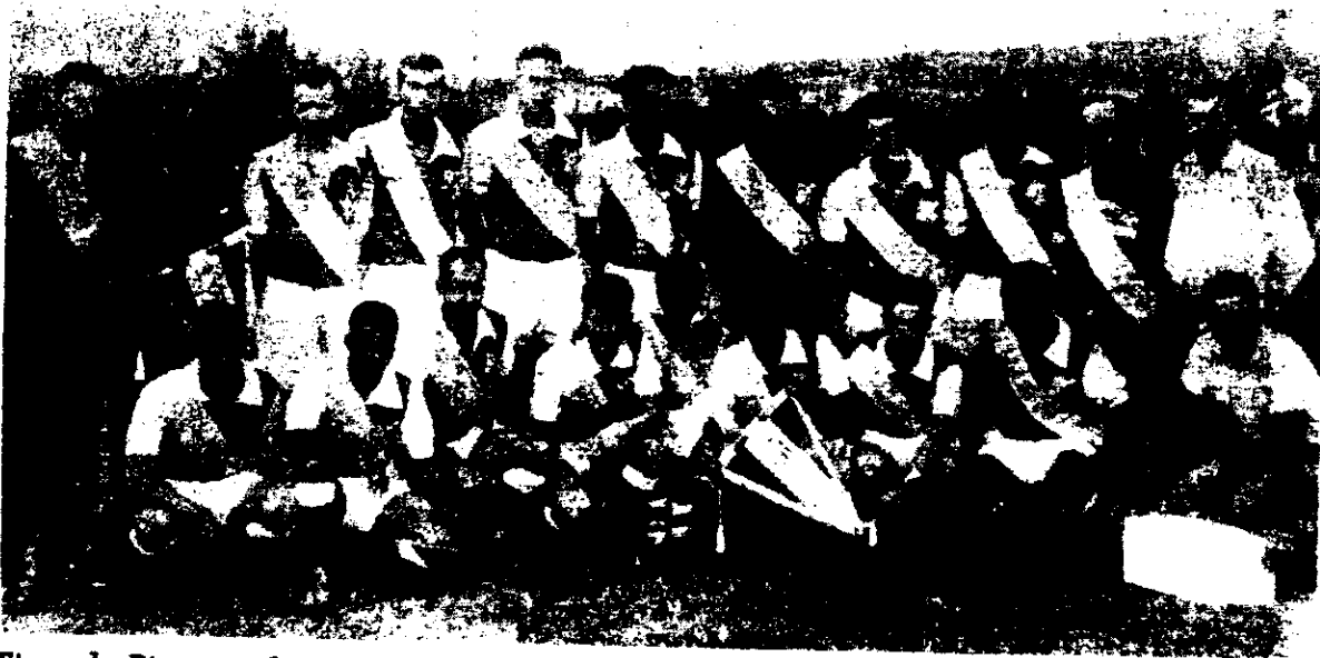
Time do Piraporinha FC, de Diadema: participação em campeonatos de São Bernardo